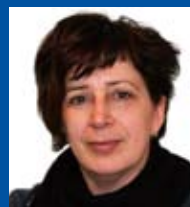
Wil Segers Vormgeving