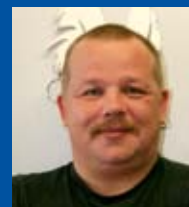
Rob Dillen Vormgeving