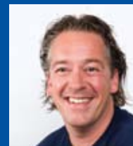
Irwin Schoonbrood Redactie