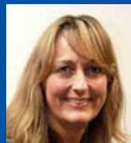
Irene Nieuwenkuiper Redactie