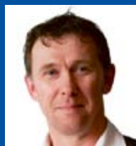
Jack kuyten Vormgeving